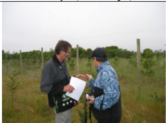
Visita ensayo progenies de Acacia (Longotoma, V Región)