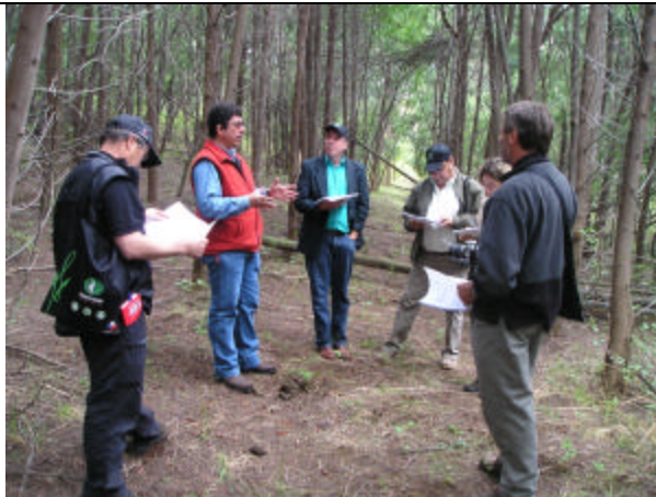
discusión en terreno ensayo progenies de Acacia dealbata (Loncoche, IX Región)