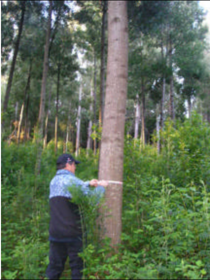
Visita Área productora de Semilla de Acacia melanoxylon (Quepe, IX Región)