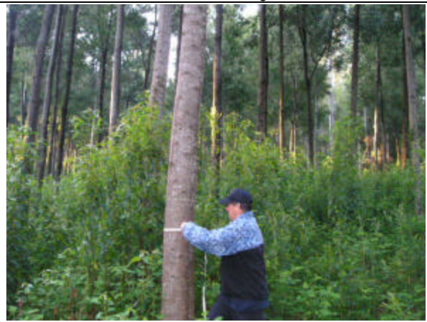
Visita Área Productora de Semilla de Acacia melanoxyton (Quepe, IX Región)