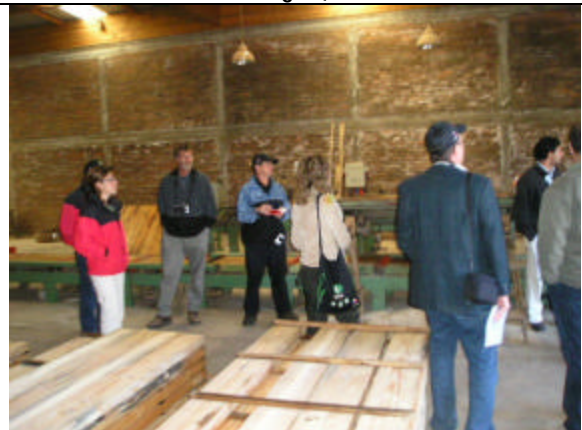
Visita planta de Parquets en base a Acacia melanoxylon (Tome, VIII Región)