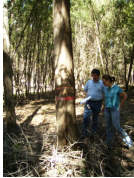
Visita ensayo Especies de Acacia (Nacimiento, VIII Región)