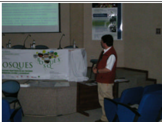
Exposición del trabajo de INFOR en sesión especial para el tema Acacias, como parte del Congreso Internacional IUFRO, La Serena 23 al 27 de octubre de 2006