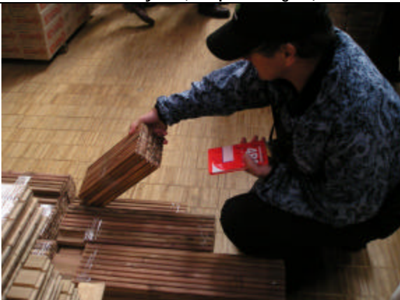
Visita planta de Parquets en base a Acacia melanoxylon (Tome, VIII Región)