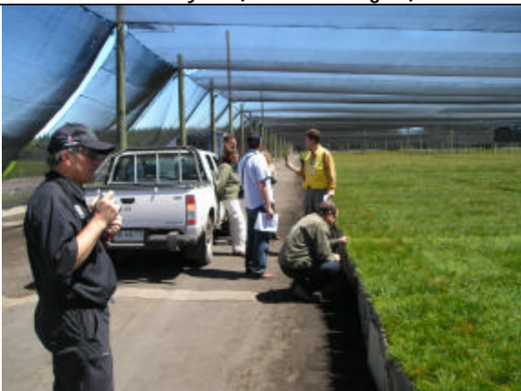
Visita vivero Forestal Carlos Douglas, Forestal Mininco (Laja, VIII Región)